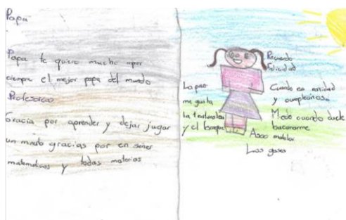
Figura 4. Autorretrato

Según Cano Murcia et ál. (2012) desde lo vivencial, las emociones se definen como alteraciones súbitas y rápidas que experimentamos desde nuestro estado de ánimo, éstas ocurren frente a circunstancias o eventos específicos. Las más comunes son: miedo, tristeza, asco, felicidad. Todas ellas son muestras de sensaciones pasajeras.