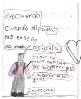
Figura 5. Autorretrato