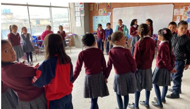
Figura 1. Círculos de paz al interior del aula

La estrategia utilizada, tiene sus raíces en los planteamientos de María Montessori a partir de las Mesas de Paz. En ese sentido, es un instrumento que a partir del diálogo y el reconocimiento se obtienen resultados desde la justicia restaurativa. El Círculo de Paz es una práctica restaurativa que reúne personas de todas las edades, bajo un encuadre de construcción conjunta de valores, creando así un espacio social seguro para el diálogo. El Círculo de Paz hace uso de elementos lúdicos, de disfrute y actividades de reflexión para acercar a las personas, a las generaciones, siendo una propuesta atractiva para niños, niñas y adolescentes. Se promueve el acercamiento de los participantes y el desarrollo de una comunicación alternativa cuya finalidad es construir consensos sobre una temática, situación o conflicto (Martínez y Bernal, 2017).