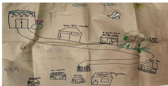
Figura 2. Elaboración trabajo cooperativo

La elaboración de mapas es una técnica que permite comprender a partir de los dibujos que niños, niñas plantean acerca del territorio de aquellos lugares y espacios de la manera como ellos y ellas los comprenden. Los mapas también permiten realizar lecturas a partir del reconocimiento y la construcción de lo social y de alguna forma desde lo político, ligados a la cultura y al mundo de quienes vivencian y elaboran la cartografía.