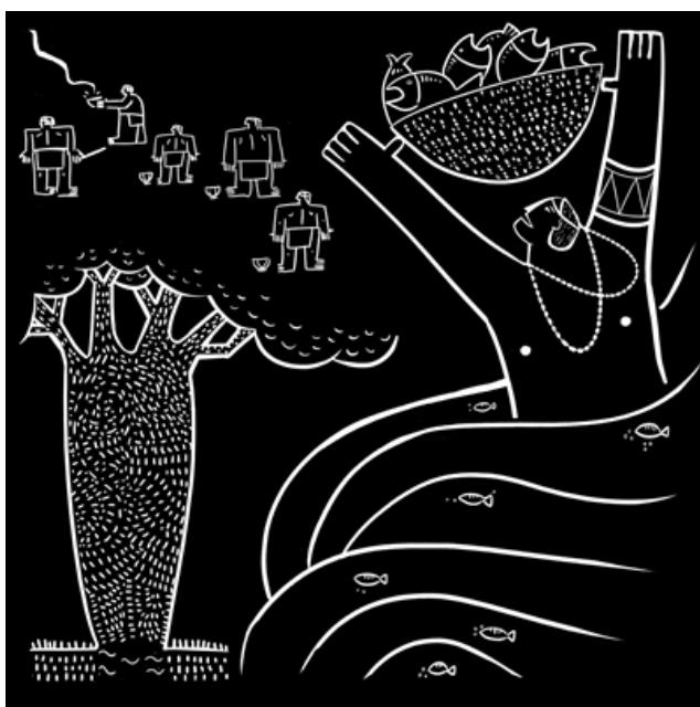
Figura 2. *Ilustración de Caragabi fundador de la sociedad Emberá

Además, algunos jai actúan como agresores, ya que causan enfermedades, guerra y muerte; el jaibaná entonces los recoge en “pueblos” y hace que estos ya no sean sinónimo de agresores, sino que sirvan como reparadores en el mundo de los hombres. Uno de los jaibanás entrevistados comenta lo siguiente: