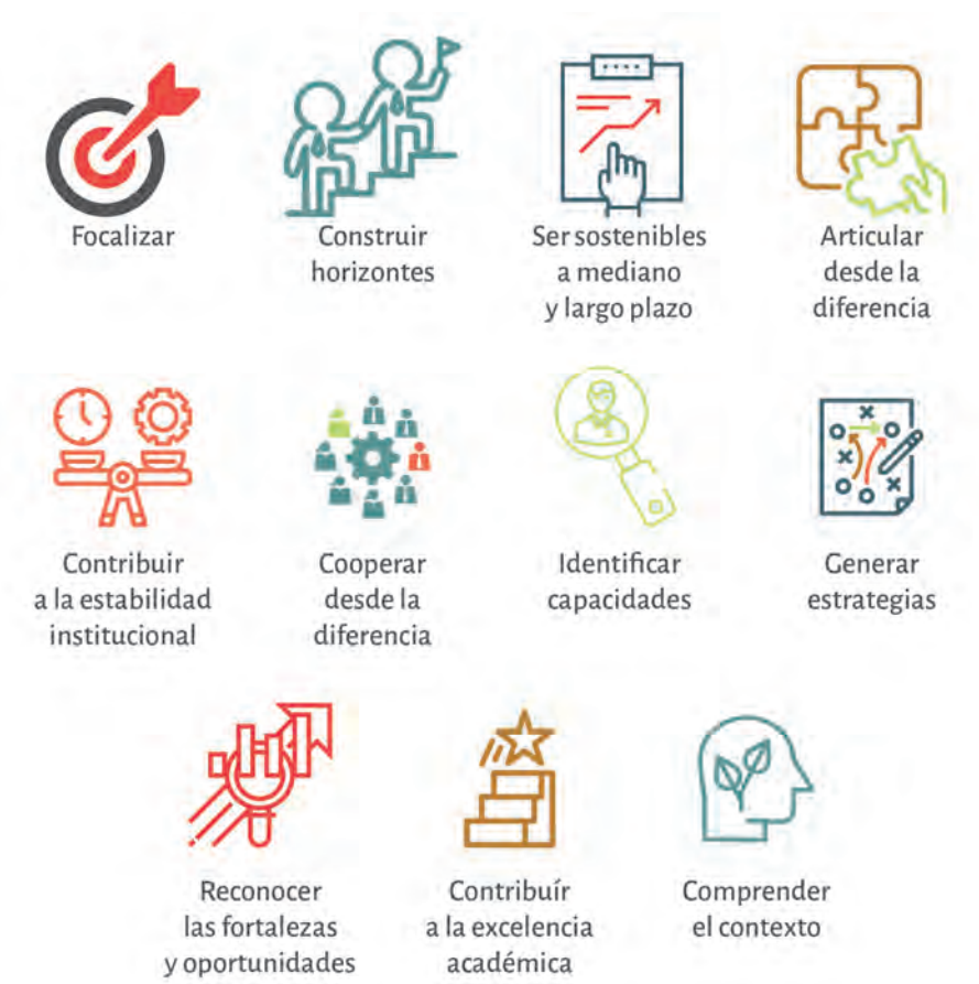
Figura 2. Identificación campos de acción

De la misma forma, permitirán a mediano y largo plazo; aumentar la visibilidad e impacto de la producción académica, facilitar la cooperación y la interdisciplinariedad para el abordaje de problemas complejos, armonizar las apuestas regionales, articular las funciones sustantivas en un contexto local, regional y nacional, hacer seguimiento y medición del impacto de las apuestas nacionales, así como orientar el desarrollo estratégico de centros e institutos de investigación, programas académicos y estrategias de responsabilidad social (Ostos y Cortés, 2019).