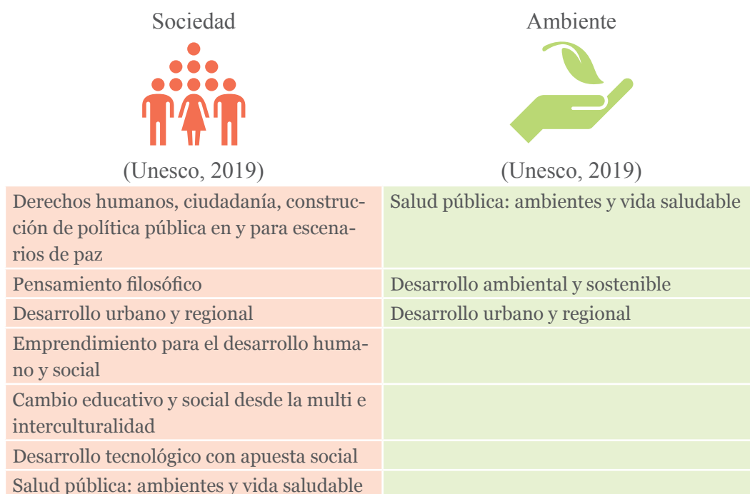
Tabla 1. Relación entre los campos de acción y las apuestas nacionales