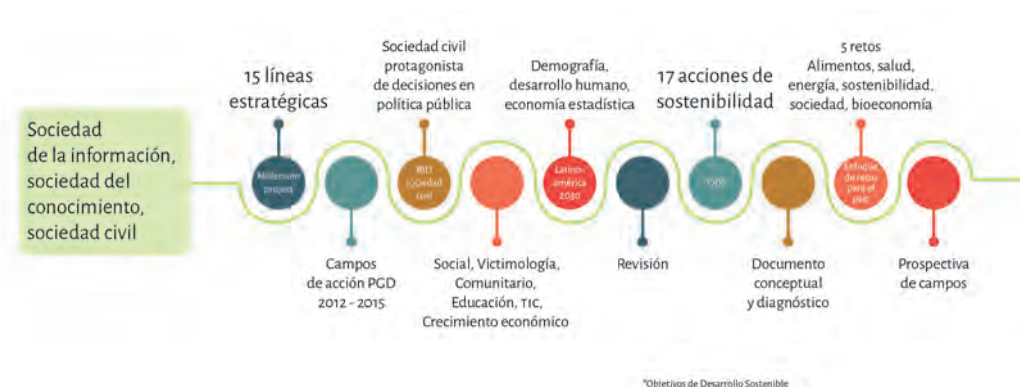
Figura 5. Inserción en retos globales, regionales y locales