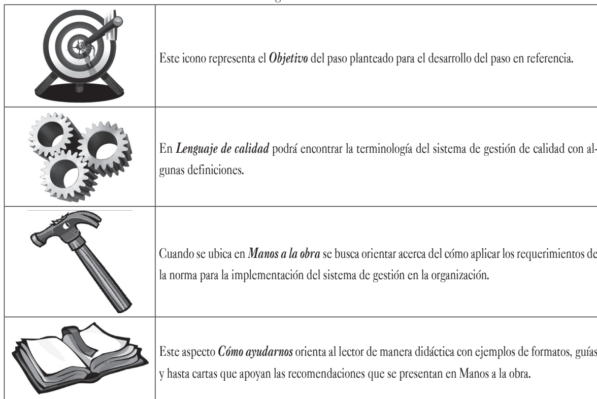
Tabla 1. Íconos utilizados en la guía didáctica diseñada

De manera complementaria a los pasos, cuando se revisa el avance, el lector podrá encontrar seis aspectos que facilitan la comprensión del contenido, incluso para consultas específicas, con una apariencia gráfica sencilla y de fácil recordación.