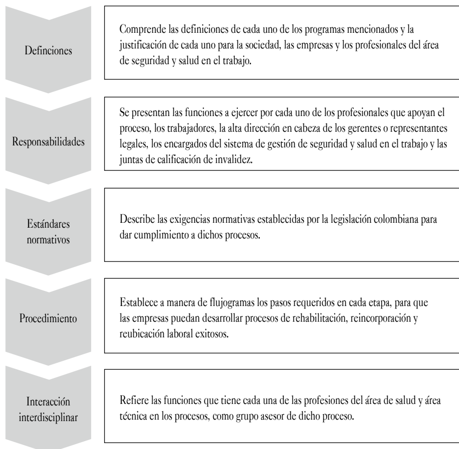
Figura 2. Contenido de la guía “De regreso al trabajo”

El análisis de la información recopilada nos lleva a establecer una herramienta didáctica que permita mejorar la comprensión y aplicación por parte de las empresas del programa de reubicación y readaptación laboral, facilitando así el reintegro efectivo de trabajadores que presentan restricciones médico-laborales, temporales o definitivas, generando a futuro casos exitosos, que permitan a estos individuos mantener su rol productivo en la sociedad. Para ello, se diseñó la guía didáctica “De regreso al trabajo”, que responde a las necesidades evidenciadas en la investigación y que consta de cinco capítulos, que se presentan en la Figura 2.