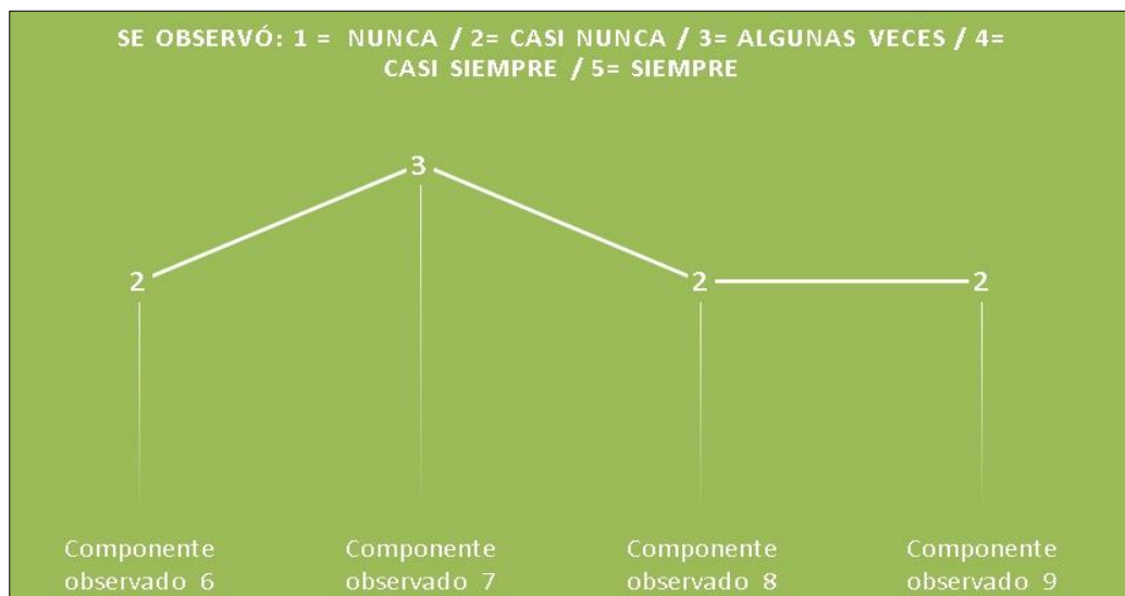
Figura 3. Fragmento gráfico 2 – Observación no participante

empleadas en el área de Lengua Castellana. Específicamente, desde el componente 1 correspondiente a la comprensión por parte de los estudiantes en las distintas estrategias de lectura y escritura utilizadas por el docente, el cual fue valorado con una calificación 5; es decir, Siempre . Teniendo en cuenta esta valoración, y de acuerdo con las observaciones realizadas, se puede notar que los niños comprenden la conducción de las distintas actividades de lectura y escritura utilizadas en el desarrollo de la clase. Desde el componente número 2, relacionado con la observación de las estrategias llevadas a cabo en el aula y cómo estas permiten fomentar el aprendizaje activo e interactivo en los estudiantes, se obtuvo una calificación de 5, que equivale a Siempre . De acuerdo con esto, en la gráfica se resalta, de manera favorable, que efectivamente las distintas estrategias metodológicas que emplea la maestra en su clase favorecen el aprendizaje dinámico entre los estudiantes, tanto en lo personal como grupal, además de desarrollar aptitudes y actitudes que contribuyen a la interacción social. En la siguiente gráfica, se evidencia el segundo segmento de la observación no participante: