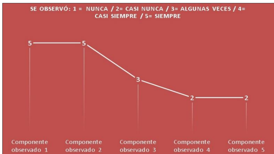
Figura 2. Fragmento gráfico 1 – Observación no participante

Consecuentemente, se percibe un reconocimiento de cada una de las imágenes presentadas, y es así como los niños lograron escribir, unir e identificar el nombre correspondiente para cada una. También se detecta que los estudiantes presentan un amplio vocabulario al identificar las palabras que se asociaban con cada imagen, de allí la importancia de la fonetización cuando se realiza de lo general a lo particular (Jaramillo y Quintero, 2020). Con base en lo anterior, se puede expresar que el proceso de lectoescritura en los estudiantes de primer grado no se da de manera estándar, ni tampoco de inmediato, sino que ante todo es un proceso gradual; es decir, se va dando por distintas etapas que depende en gran medida del estímulo que reciban del medio en el que se encuentren, a través de lo que observan en el contexto, como las lecturas e interpretaciones que realicen del mismo y del trabajo que se efectúe en la escuela serán, entonces, las medicaciones que les permitirán ir alcanzando estas etapas a un ritmo diferente. En este orden de ideas, se mostrarán los datos alcanzados en la ejecución de la observación participante.