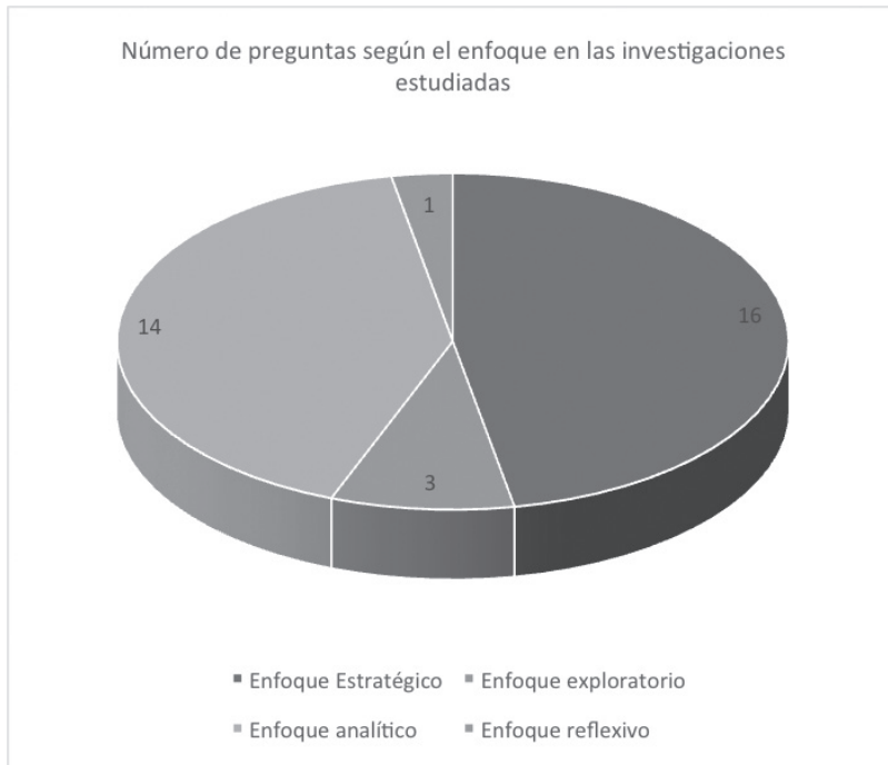
Figura 2. Número de preguntas según el enfoque en las investigaciones estudiadas

Actualmente hay dos tendencias fuertes en investigación en Lengua Castellana: la tendencia socio cognitiva y la tendencia semiodiscursiva. En esta última se tienen en cuenta: