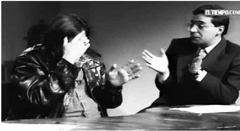
Figura 2. Caballero exasperado