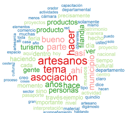
Figura 2. Conceptos más importantes expresados por los entes de apoyo en su percepción de los artesanos de Filandia

Nota: La nomenclatura de colores-tamaño y categorías es idéntica a la de la figura 1.