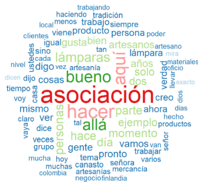
Figura 1. Conceptos más importantes expresados por los artesanos de Filandia frente a su quehacer