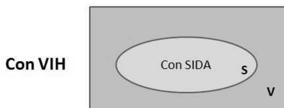
Figura 1: Representación del espacio muestral conformado por todos los que portan el VIH (tamaño V ) y subconjunto de aquellos que padecen sida (tamaño S ).

Sin embargo, el cálculo de sus componentes no se puede realizar mientras no se fije un espacio de probabilidad (\Omega, P) . Si fijamos que \Omega es el conjunto de todas las personas que tienen VIH (supongamos que tiene tamaño V ) y consideramos que A es el conjunto de quienes tienen sida (de tamaño S ), gráficamente, la situación es la que se registra en la Figura 1.