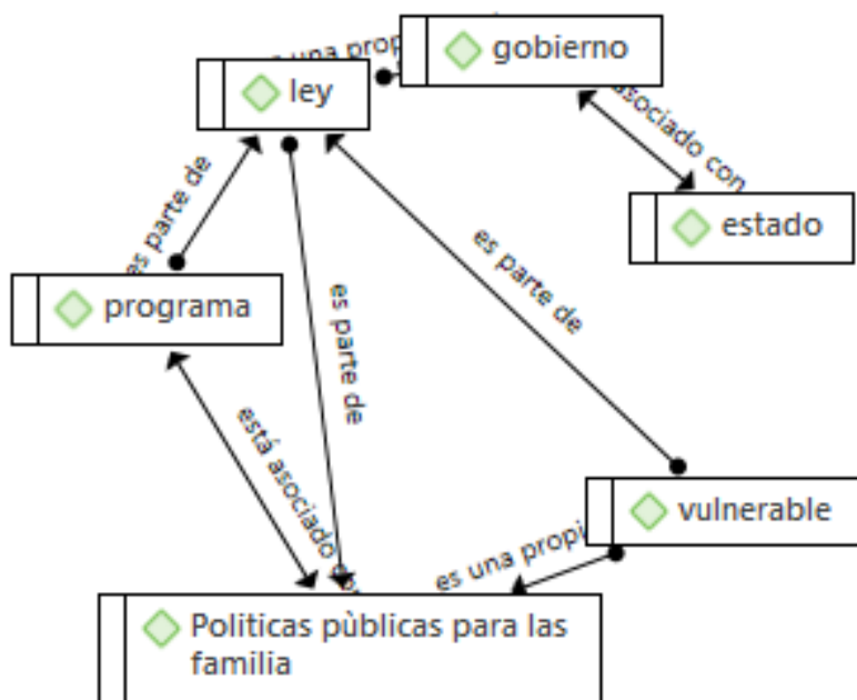
Figura 2. Categoría políticas públicas.