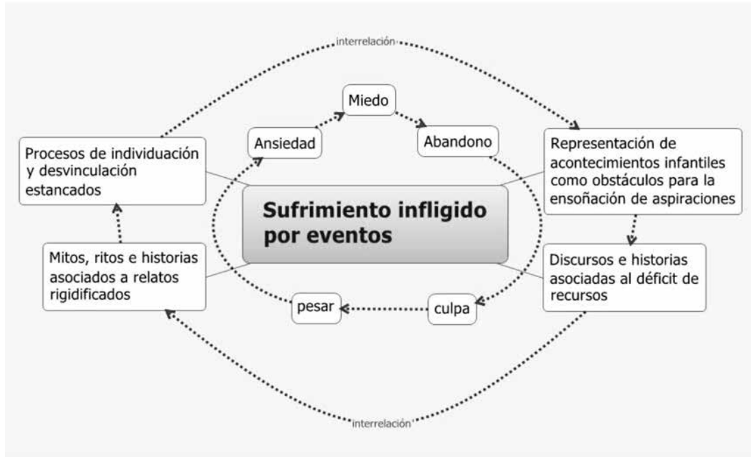
Figura 1. Procesos interactivos que coexistían con los motivos de consulta.