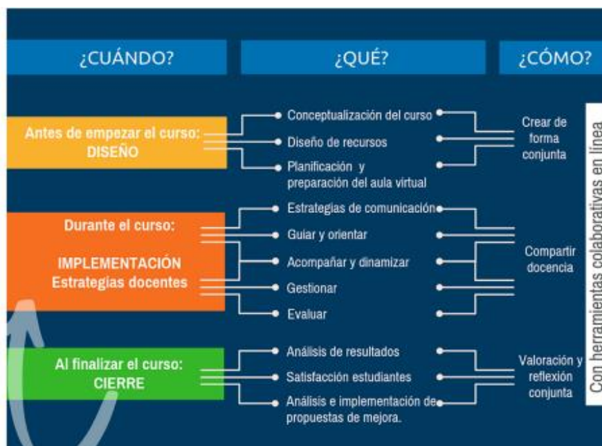
Figura 1. Estrategias docentes en línea: ¿cuándo?, ¿qué? y ¿cómo?

En el artículo “Estrategias para la docencia en línea”, se habla del nuevo rol del docente, que tiene que adquirir en la era digital; de acuerdo con este, el docente adquiere un rol y se enuncian algunas de las funciones que el profesor debe proporcionar como guía y orientador del proceso de aprendizaje de los estudiantes. Las tecnologías, además del acceso a la información, también facilitan procesos de comunicación, colaboración y creación de contenidos, lo que propicia que el trabajo del docente se acerque más al acompañamiento y la dinamización (Catasús Guitert y Fontanillas Romeu,).