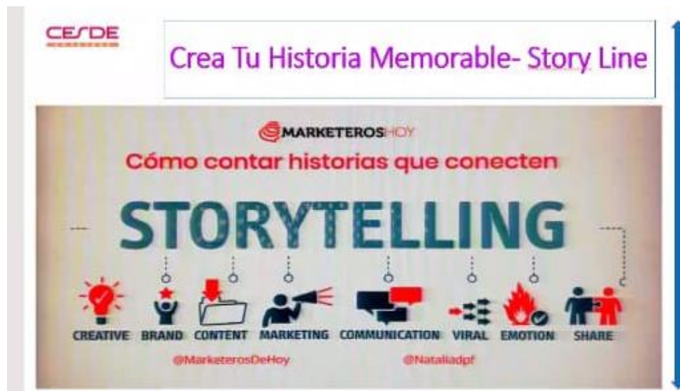
Figura 1. Ejemplo storytelling.