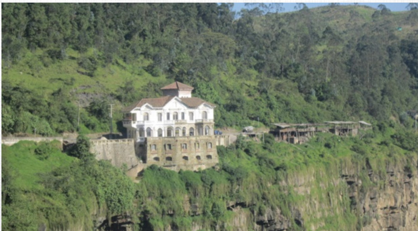
Foto 4. Fachada posterior Casa Museo Salto de Tequendama