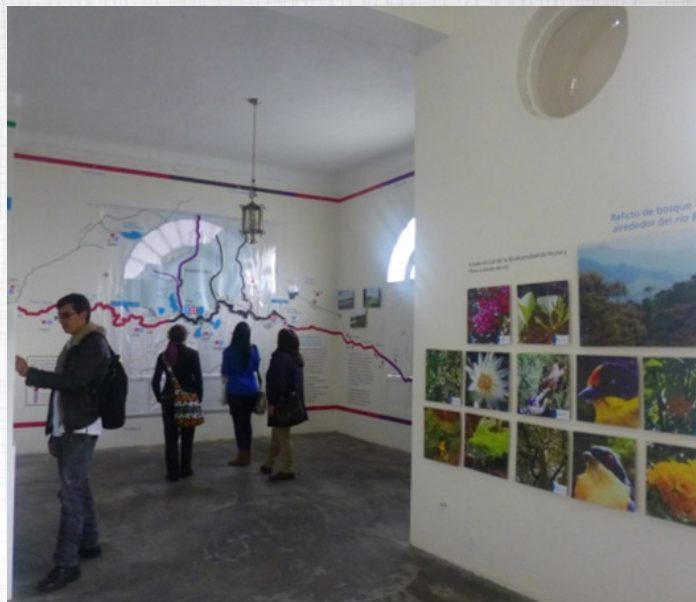
Foto 3. Expografía en Casa Museo Salto de Tequendama

La invitación es para que, en tanto colombianos, respetemos ese don que se nos ha dado como Patria y hagamos la tarea para conservarla. Cumplir unos pocos deberes ciudadanos tales como botar apropiadamente la basura, resaltar a los constructores que respetan nuestro río conservando los entornos naturales, disponer apropiadamente de las aguas residuales en sus urbanizaciones, y apoyar la formación consciente del cuidado del medio ambiente en los niños y jóvenes para tener cada día una verdadera cultura ciudadana que respete su riqueza natural. Pocas acciones, que permitirán a futuro consolidar los procesos culturales, los cuales facilitarán la recuperación del río Bogotá y su hermoso Salto de Tequendama.