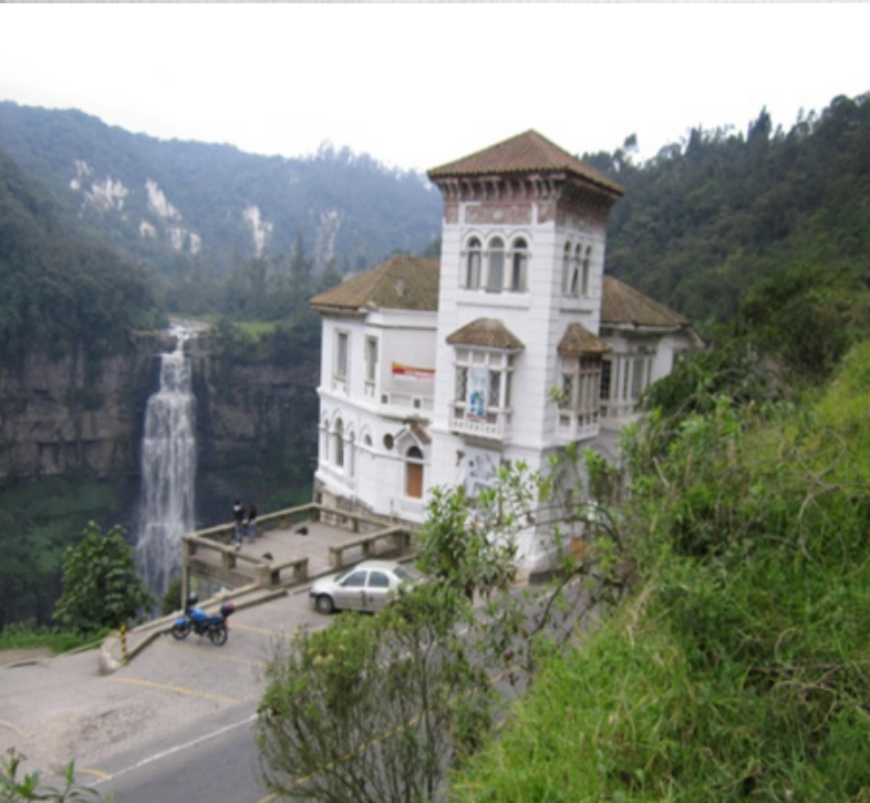
Foto 1. Casa Museo Salto de Tequendama

Al considerar las palabras, del entonces Cardenal Bergoglio, en la conferencia episcopal Argentina, en la que mencionaba que “La Patria es un don que hemos recibido; la Nación una tarea que nos convoca y compromete nuestro esfuerzo”(El Ciudadano & la gente;2010), enunciado en el que se percibe una de las mejores definiciones que se ha leído sobre responsabilidad ciudadana, pues recuerda abiertamente que como habitantes de un territorio se tienen muchos derechos pero también deberes.