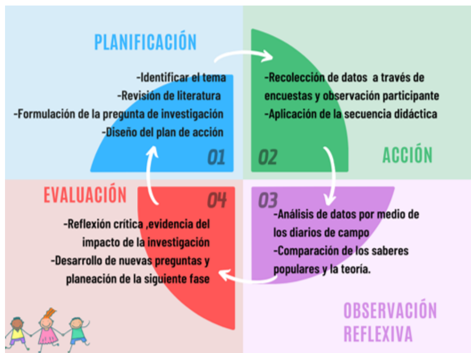
Figura 2. Fases de la investigación