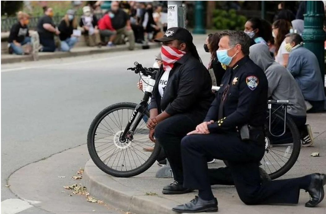
Figura 1. El jefe de la policía de Santa Cruz, California, se arrodilló junto con los manifestantes en una protesta pacífica en contra de la brutalidad policial ejercida a Floyd

observa en la figura 1. Estas acciones volvieron las protestas de BLM diferentes a otras, debido a la diversidad de actores sociales que participaron construyendo espacios físicos y virtuales a partir de la ruptura de ciertos límites.