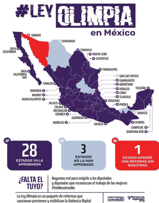
Figura 2. Twitter del Frente Nacional para la Sororidad (Twitter, 2021)

Por otro lado, como ya mencionamos, se ha creado dentro del territorio nacional el movimiento de #LeyOlimpia que ha sido adoptado por la mayoría de los estados de la República, a saber: