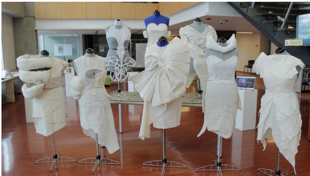
Figura 5. Exposición Modular 1º Semestre Profesional en Moda.