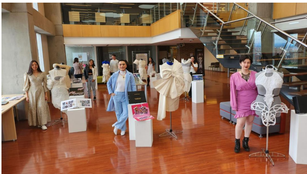
Figura 6. Grupo de estudiantes 1º Semestre Profesional en Moda.