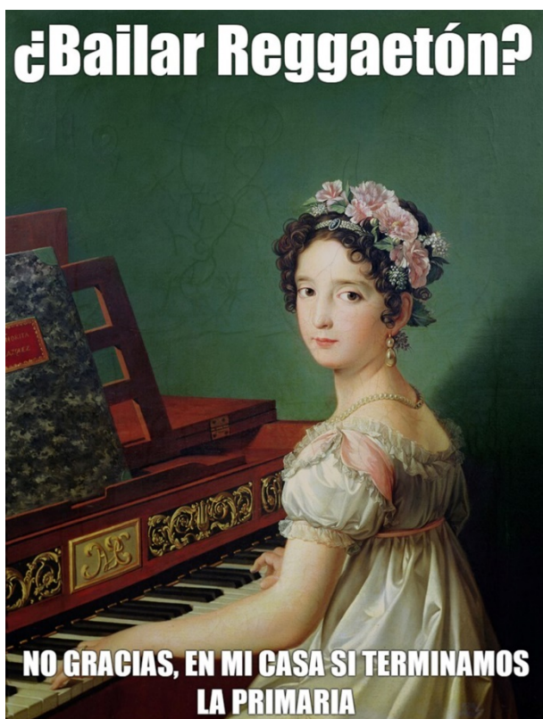
Figura 7. No bailo reggaetón.