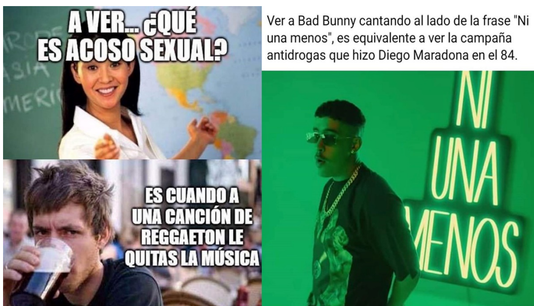
Figura 1. Sobresimplificación de un problema social.

que pueda ocupar el reggaetón en problemáticas reales y urgentes para nuestra sociedad. ¿Qué es el acoso sexual? Circunscribiendo la discusión al contexto social-cultural (no al ámbito jurídico-penal), es muy fácil notar que no es una pregunta fácil de contestar. El mito que se ha construido alrededor del reggaetón instauro artificialmente un orden sobre el escenario caótico que se desprende de la pregunta; una vez instaurado el mito, se evade la presión por analizar críticamente el problema, por atender a sus grises, siendo este análisis reemplazado por una máxima simple pero mítica y equivocada: