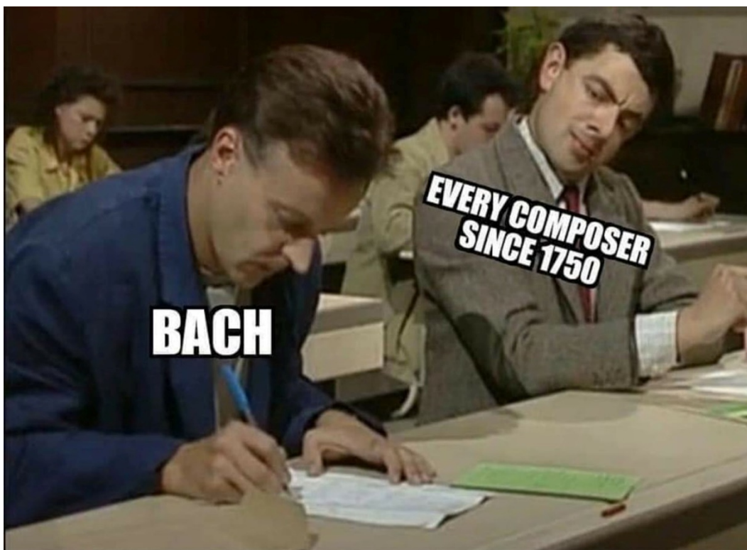
Figura 5. Sin Bach no habría nada más.

anclaje “extralimita el orden de lo propiamente racional” (Carretero, 2006, p. 108).