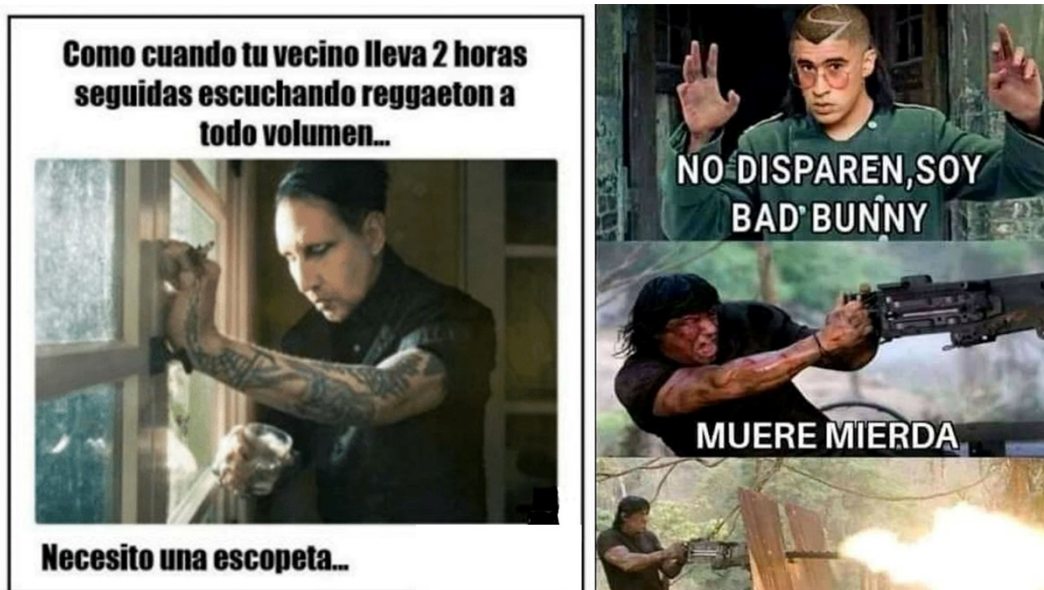
Figura 6. Odiamos al reggaetón.

El fanatismo por un determinado tipo de música genera también actos discriminatorios contra comunidades musicales opuestas, las cuales son vistas y, lo que es aún peor, tratadas como inferiores a la elegida como propia [...] Me refiero a la alarmante violencia verbal con que hoy en día enfurecidos grupos de fans de una música dada arremeten en las redes sociales contra otras comunidades musicales, [...] como si las divergencias musicales fueran un asunto de tanta envergadura que justificasen desatar una cruzada por el gusto adecuado. (Mendívil, 2016, p. 115)