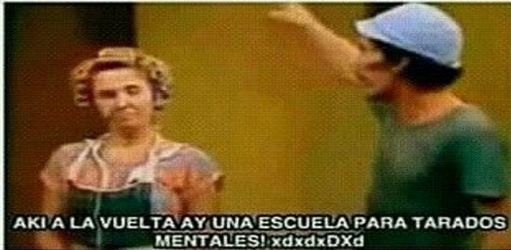
Figura 3. El reggaetón es un arte.