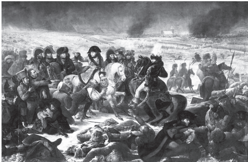
Antonie Jean Gros Napoleón en Eylau . 1808

Un cuadro representativo de esta tendencia histórica fue Napoleón en Eylau (1808) de Antonie Jean Gros.