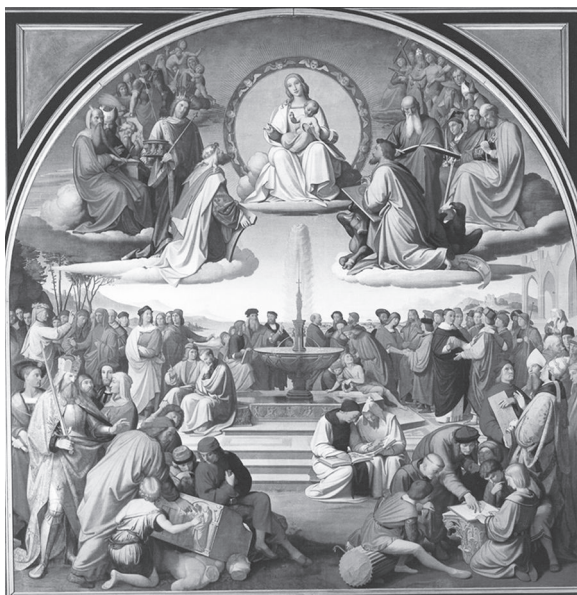
Overbeck Triunfo de la religión en las artes . 1831-1840

La conjugación de estos dos objetivos dio como resultado una manifestación artística que se propuso reexpresar la teoría neoclásica, pero bajo un lenguaje profundamente cristiano. Una muestra de los alcances que tuvo la realización de estos objetivos es el Triunfo de la religión en las artes (1831-1840) de Overbeck.