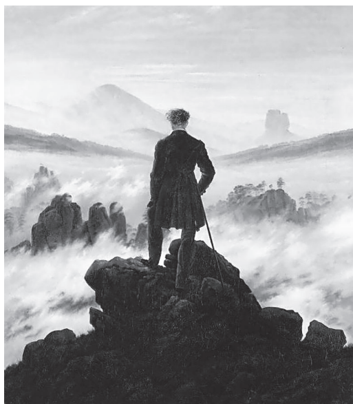
Friedrich El caminante sobre la niebla . 1817-1818

El caminante sobre la niebla (1817-1818), es, tal vez, el cuadro que más se aproxima a un contacto espiritual entre el hombre y su entorno. Ésta es una comunión que escucha a la naturaleza, que sabe que muy pronto estará a su lado 27 :