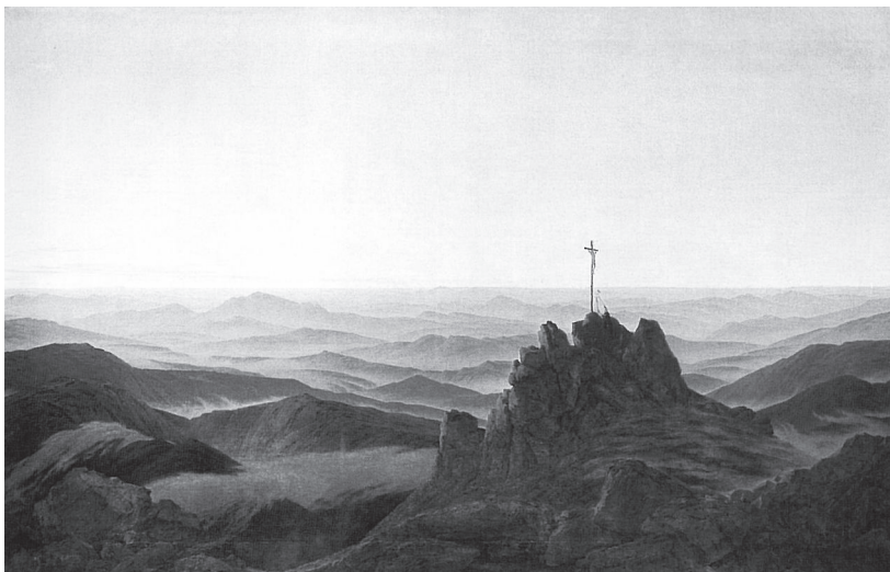
Friedrich Mañana en el Riesengebirge. 1810-1811

Uno en todo y todo en uno la imagen de Dios en las hojas y en las piedras, el espíritu de Dios en los hombres y en los animales, esto debe quedar impreso en el alma.