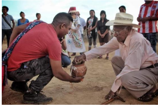
Figura 4. Publicaciones #Territorio

Fuente: Red Comunicaciones Wayuu. Publicación realizada el 17 de noviembre de 2024 a través de Facebook.