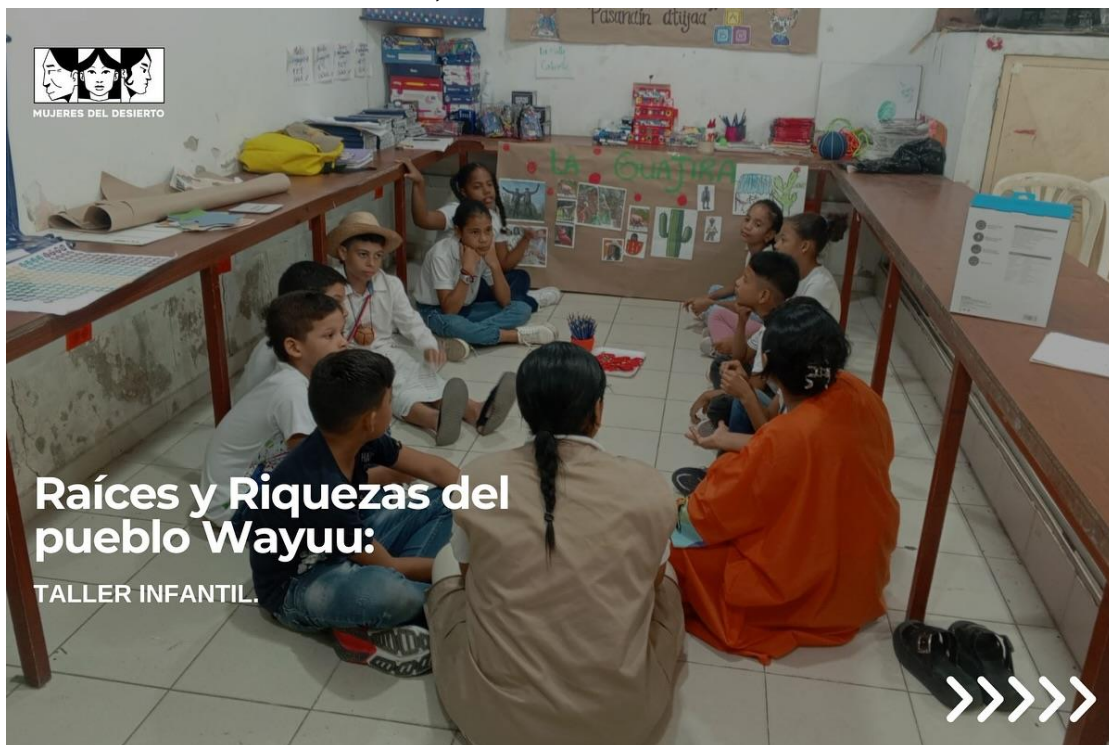
Figura 2. Publicaciones #Yanama, comunidad

Fuente: Colectivo Mujeres del Desierto. Publicación realizada el 2 de agosto de 2024 a través de Instagram.