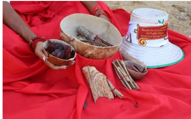
Fuente: Red Comunicaciones Wayuu. Publicación realizada el 2 de septiembre de 2024 a través de Facebook

La vestimenta propia es un elemento más que estético. Varios de los contenidos incluyeron personas wayuu usando vestimentas tradicionales, como una reivindicación que refuerza la identidad cultural y el sentido de pertenencia. Visualmente se consolida como un elemento clave de representación de su cosmovisión.