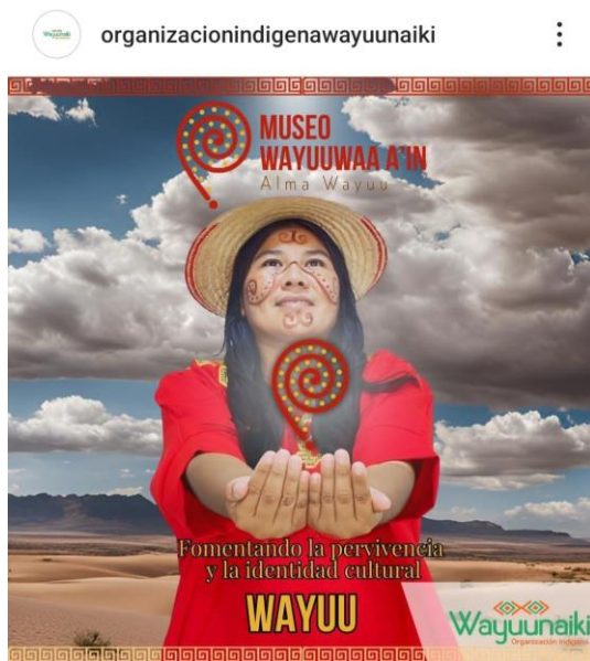
Fuente: Organización Indígena Wayuunaiki. Publicación realizada el 11 de agosto de 2024 a través de Instagram