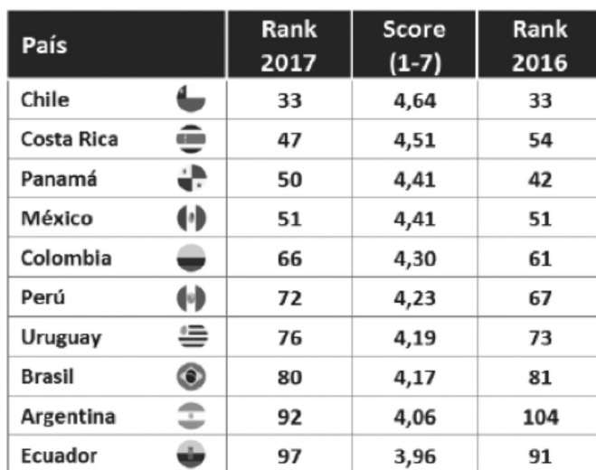
Figura 2. Colombia en el Índice de Competitividad Global